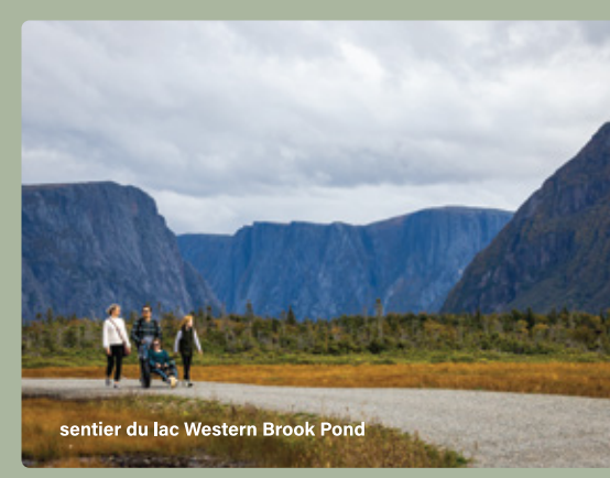
sentier du lac Western Brook Pond