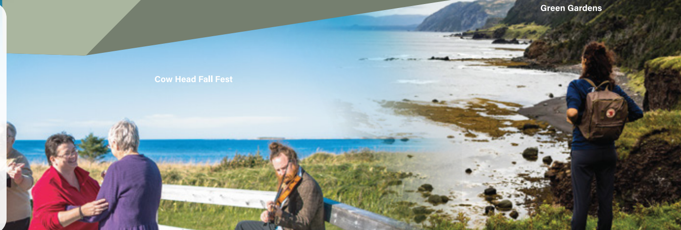
Cow Head Fall Fest