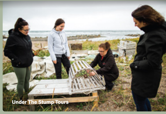
Under The Stump Tours